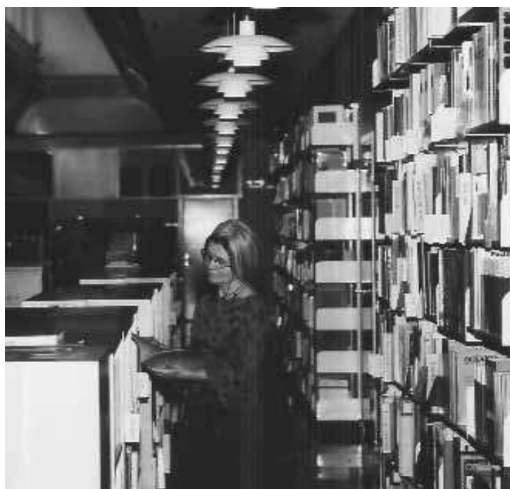
Interior de la Biblioteca del Museo Etnográfico de Estocolmo.

l'isle Maragnan et terres circonvoisines de Claude d'Abbeville pagó 1 465 SEK. Los precios pagados se pueden poner en relación con el salario anual de 4 000 SEK que ganaba con la cátedra que obtuvo en Göteborgs högskola en 1924 18 . Dedicó 22 años a buscar Bolivia: die Franciscaner von Tarata und die Indianer de Wolfgang Priewasser 19 . Lo que adquirió fue realmente una biblioteca personal aunque siempre la ponía a disposición de sus discípulos e investigadores de visita. Durante su expedición a Panamá en 1927, por ejemplo, los libros fueron depositados en el museo para ser accesibles durante su ausencia. El catálogo de la biblioteca publicado por el museo contiene 1 802 números 20 . Físicamente contiene 3 000 volúmenes, a más de separatas que Nordenskiöld hizo encuadernar por autor o materia. Se puede comparar con los 300 libros aproximadamente que, según S. Henry Wassén, tenía en 1929 el propio museo 21 . Después de la muerte de Nordenskiöld el museo pudo comprar su biblioteca de la viuda Olga Nordenskiöld (1887-1959) gracias a dos donaciones anónimas. En 1935 empezó la publicación de la serie del museo Etnologiska studier lo que significó mejores posibilidades de canje ya que antes dependían de