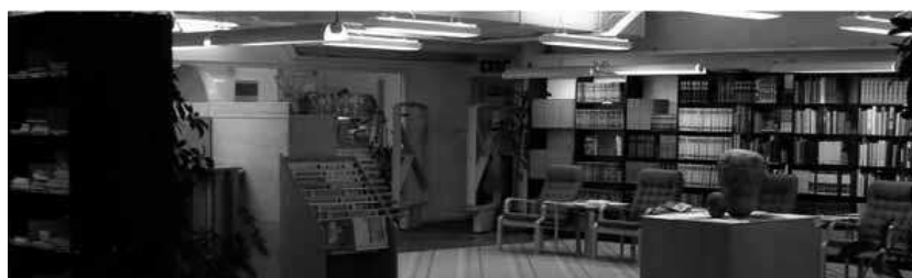
Interior del Instituto de Estudios Latinoamericanos de Estocolmo

el Instituto fue reorganizado como una entidad estatal independiente con estatutos que especificaban más o menos las actividades que se habían efectuado desde el principio. El Premio Nobel de Economía Gunnar Myrdal (1898-1987) fue el primer presidente del nuevo consejo directivo. La biblioteca fue subordinada a la Biblioteca Real. En 1977 el Instituto fue incorporado en la Universidad de Estocolmo y la biblioteca fue afiliada a la Biblioteca Universitaria ; en 1985 se trasladó al campus principal de la Universidad a los locales que todavía ocupa. Desde 2000 el Instituto forma parte del Departamento de Español, Portugués y Estudios Latinoamericanos, pero con su propio consejo directivo. Entre 1973 y 1990 funcionó como secretariado de NOSALF – Nordic Association of Latin American Studies con el soporte del Consejo Nórdico y en 1994 fue uno de los organizadores del 48 Congreso Internacional de Americanistas 10 . Las publicaciones principales son la revista Iberoamericana y la serie Monographs a las que se añaden varias series de trabajos y ponencias 11 .